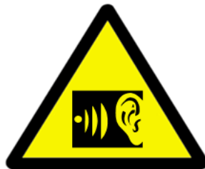
Figure 1 – Warning label

To prevent possible hearing damage, do not listen at high volume levels for long periods.