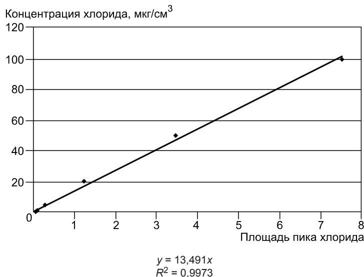
Рисунок 3 — Типичный калибровочный график хлорида

Примечание — Если коэффициент корреляции графика для значений площади пика, построенный методом наименьших квадратов, составляет менее 0,99, то прибор и калибровочные растворы должны быть проверены на возможность ошибок, и при необходимости калибровку повторяют, начиная с раздела 9.